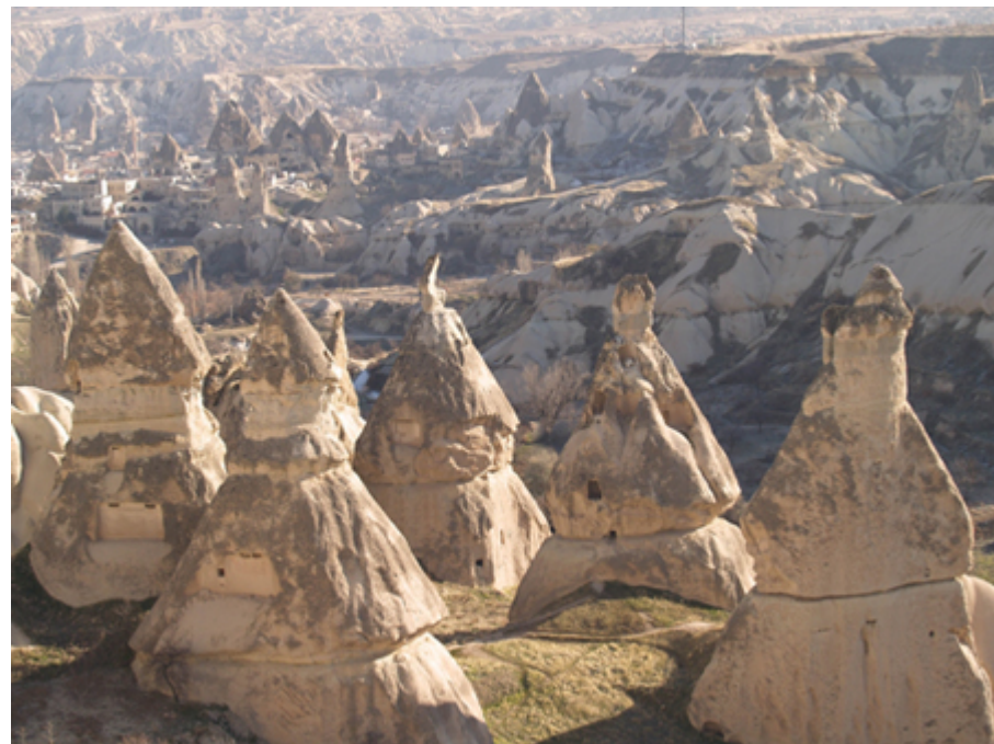
Goreme i Pamukale, Turska