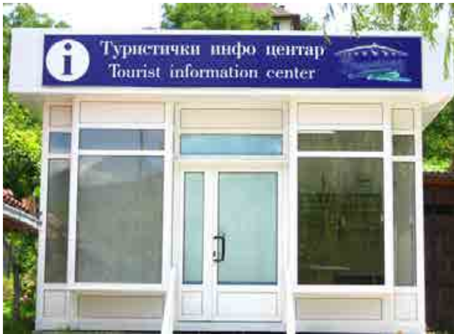
Turistički info centri