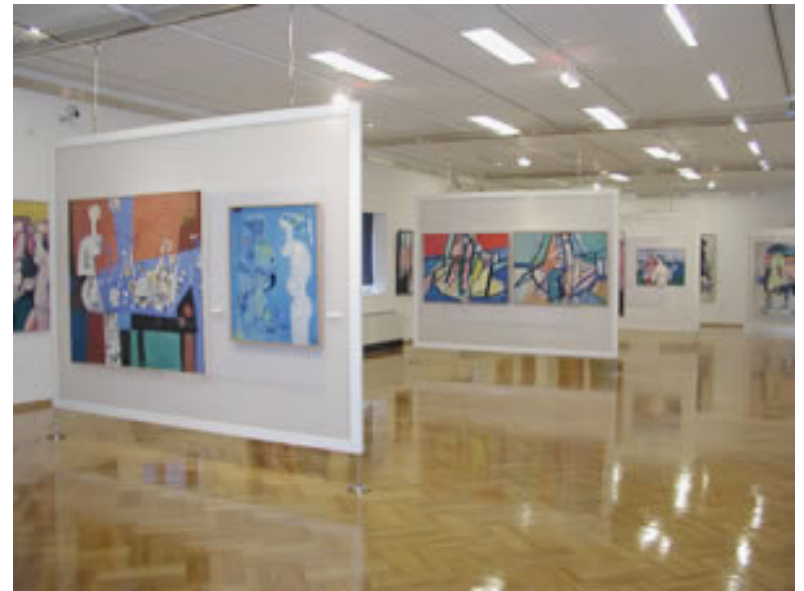
Muzeji i galerije