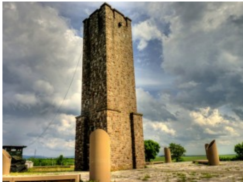
Vaterlo, Gazimestan, Brankovina