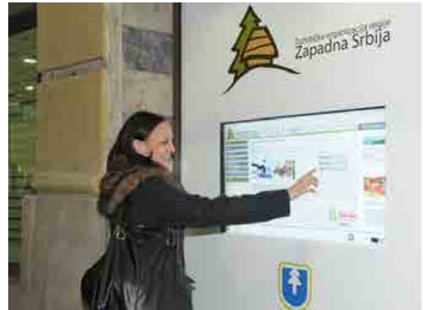
Turistička informativna sredstva