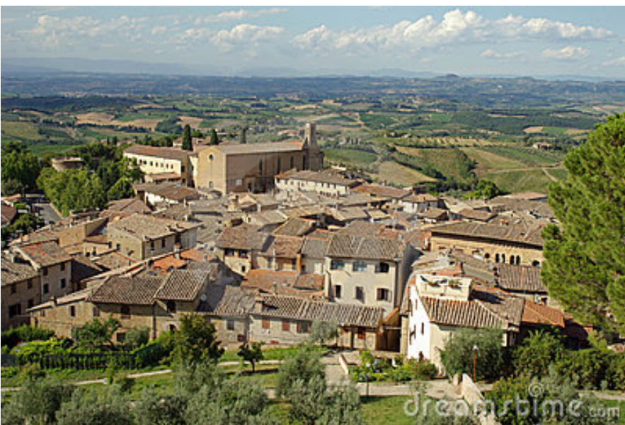
Stara sela - zaštićene ruralne celine